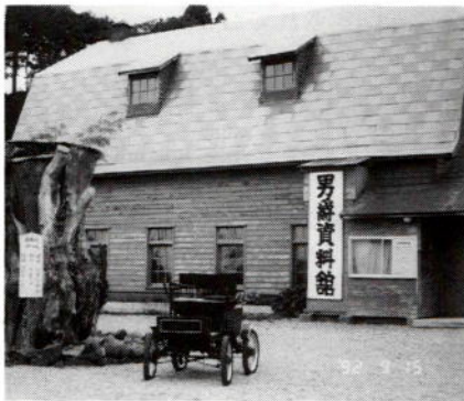
（写真-1）男爵資料館正面

函館市から西方へ松前街道を約30km、函館湾口に面した上磯町当別の地に“男爵資料館”（写真-1）と称する施設があり、ここの特別展示品に“Locomobile”蒸気自動車がある。この自動車は故川田龍吉男爵が明治35年ごろ、当時東京芝口に開店したばかりの“The Locomobile Co. of America 日本代理店”にて買い求めたものと伝えられ、日本人が使用し、かつ現存する最古の輸入自動車と考えられる。