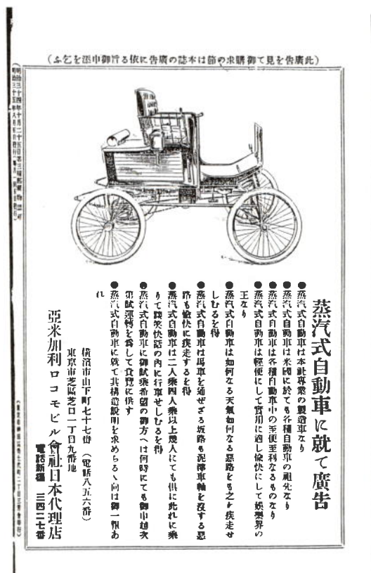
（写真－3） 月刊雑誌「輸友」広告 明治35年8月発行，第10号