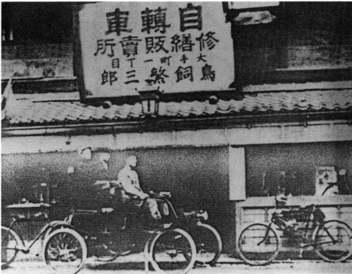
(写真二) オールズモビルを改造した4人乗り乗合自動車。