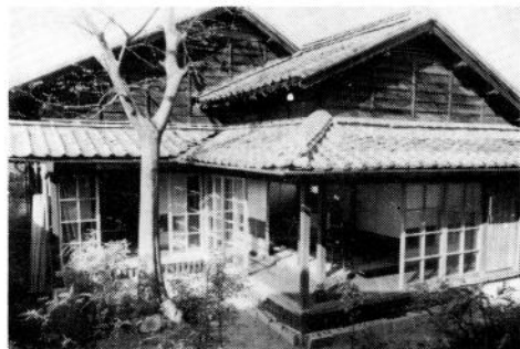
南側から見た同旧居