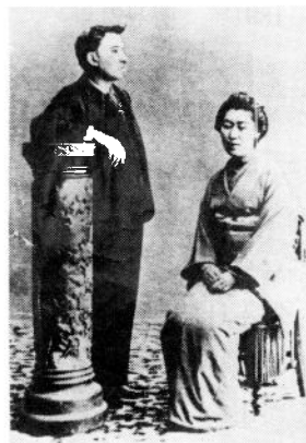
熊本時代のハーンとセツ

これは、わたくしが熊本から貴君に差し上げる最後の手紙です。非常な病気だという公務上の口実の下に、わたくしは一両日中に去るのですから、わたくしの幸運を祈ってください。何故なら、行く先がどうなるか、わかりませんから。今後わたくしへの手紙は、神戸